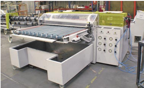
Aufteilautomat für Lamine