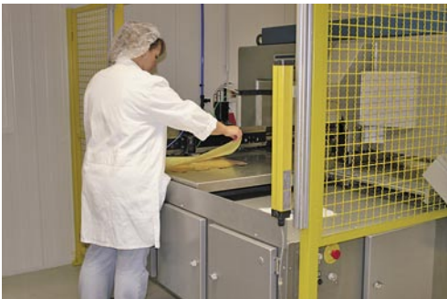
Stanzen von Prepregs