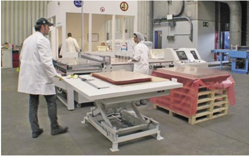
Zuschnitt von Laminaten